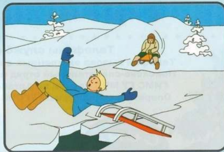
Под снегом могут быть трещины и разломы.