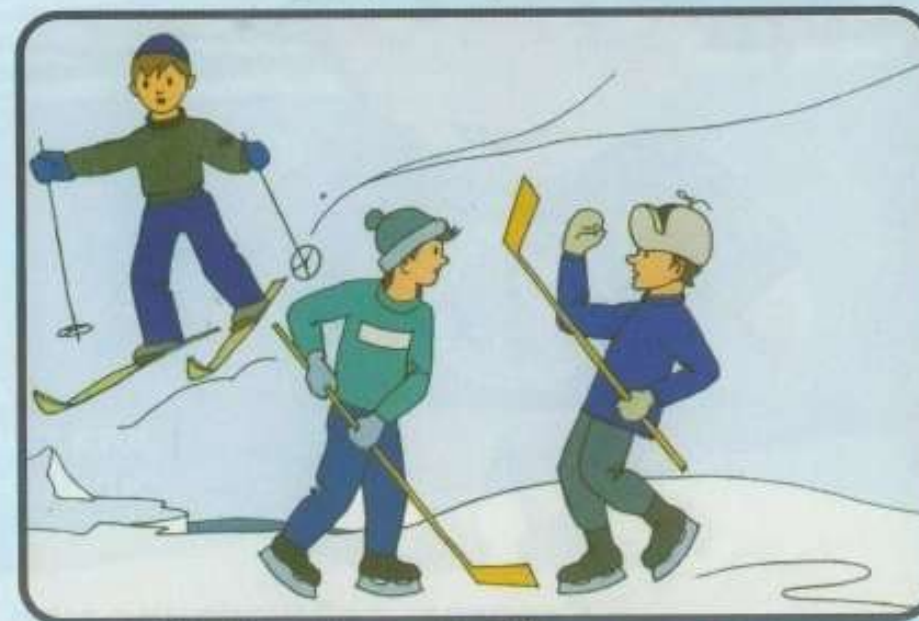
Под снегом могут быть полыньи, трещины или лунки.