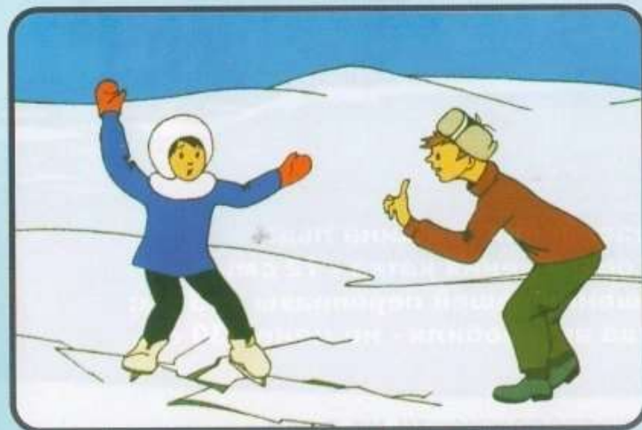
Если под вами затрещал лёд, ложитесь, и плавно перекачивайтесь в безопасное место.