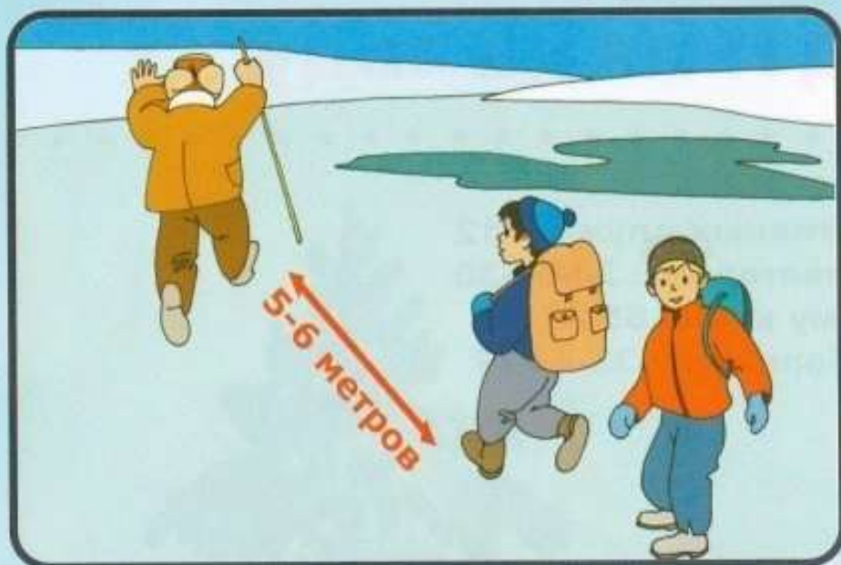
При переходе по льду следовать друг за другом на расстоянии 5-6 м.